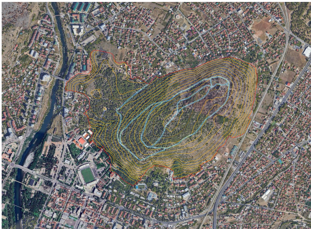
Slika 1. Zahvat Konkursa

Zahvat konkursa obuhvata katastarske parcele 1745/2, 1942, 1989, 1990, 2070/1, 2071, 2095/1, 2095/2, 2124, 2126/2, 2126/3, 2126/4, 2146/1, 2146/4, 2146/5, 2147/1, 2147/2, 2148/1, 2148/2, 2149/1, 2149/11, 2150, 2151/1, 2151/2, 2152, 2153, 2154, 2155/3, 2156/1, 2198/1, 2200/3, 2200/4, 2200/5, 2201, 2202/1, 2202/5, 2202/6, 2269/2, 2269/5, 2280/1, 2280/3, 2280/6, 2281, 2282, 2283/1, 2283/3, 2388/1, 2589, 2590/3, 2594/1, 2594/19, 2595, 2596, 2597, 2599, 2600/1, 2601/1, 2601/164, 2601/165, 2601/6, 2601/7, 2602, 2603/1, 2603/16, 2603/17, 2603/175, 2603/2, 2603/20, 2603/27, 2603/3, 2603/46, 2603/47 i 2603/48 KO Podgorica II, (Slika 1).