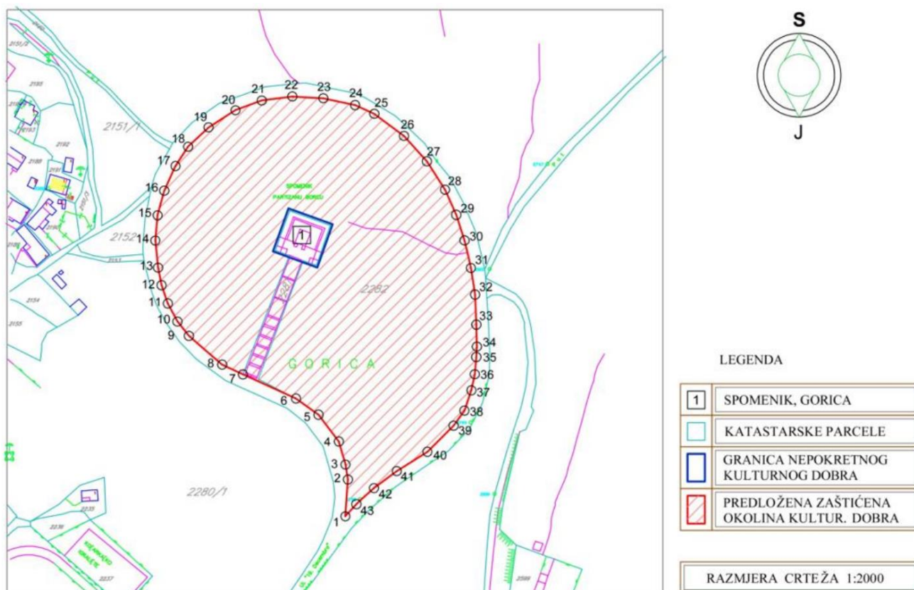
Slika 4. Položaj Spomen-grobnice palih heroja, za zaštićenom okolinom kulturnog dobra